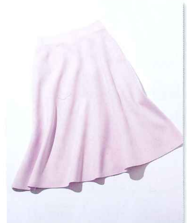
GLIT COMMUN ゲーコミュン

程よいボリューム感が 甘さを抑え品よく着られる 膝が隠れる着丈なら、甘くなりちなピンク も上品に着こなせます。スカート¥14,000(グ ーコミュン/グランスカケドイック)