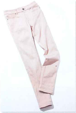
7-1 Deconcept セブナイディコンセプト