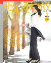
即完売の商品も、ご注意ください!

[別冊付録] 3カ月先まで 着られる服が満載! デジタル通販マガジン 「セレSTORY」 第47弾