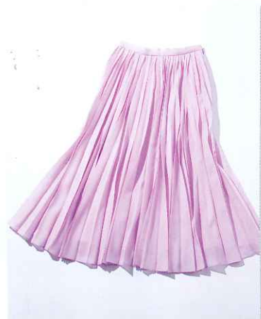
STUNNING RULE スタングルアー

広がすぎないプリーツと 絶妙なカラーが大人可愛い さらさらした肌触りのいい素材のスカートは 今から夏まで使える優秀アイテム。裏地付き なの嬉しい。スカート(モデル着用分)